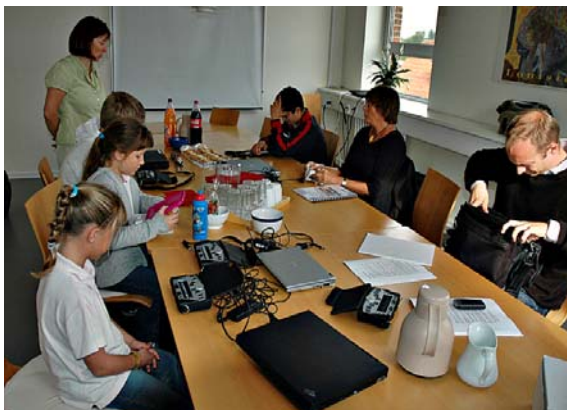
Blinde børn undervises i brug af punktmaskiner.