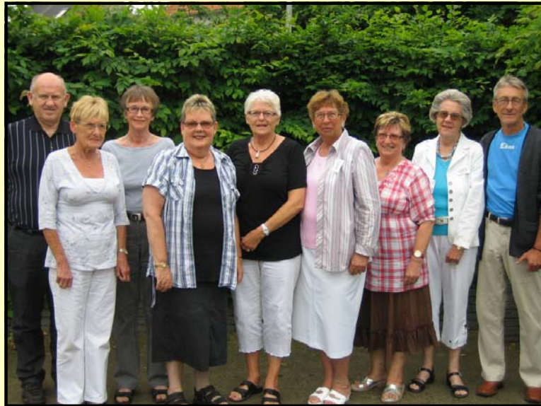
Billede af det nye brugerråd Fra venstre:

Så hermed en stor tak til personale og frivillige for et kæmpe arbejde,