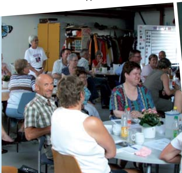
billede t.h. Borgermøde i Badeanstalten i oktober 2007