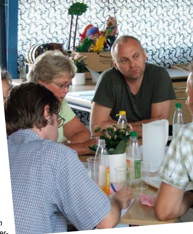
Gruppediskussion ved fokusgruppemødet i Vasac Kulturhus i juni 2007

Vi vil have handlekraft, mangfoldighed og specialviden til at levere det bedste. Vi vil som kommune handle proaktivt både for at give borgerne