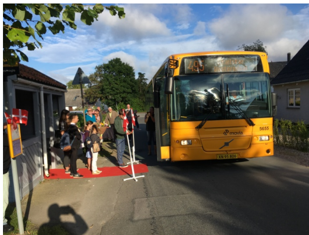
Foto af fejring af bla. ny busrute til Flakkebjerg, Dalmose Slagelse.

TAK FOR DU/I TOG TID TIL AT BESVARE SPØRGSMÅLENE.