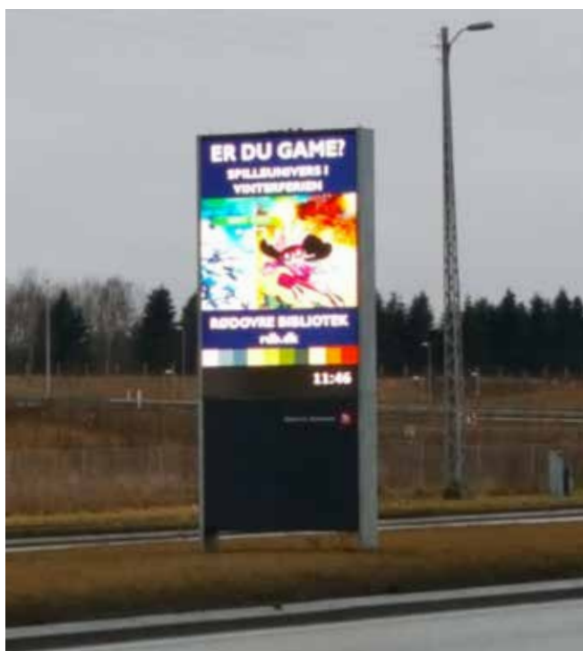
En elektronisk infostander på Næstved Landevej

Mange bilister kører forbi på Slagelse Landevej uden at kende til Sørbyområdet. Med en elektronisk infostander ved indkørslen til Sørbymagle, kan vi formidle lokalrådets mange tilbud til forbipasserende.