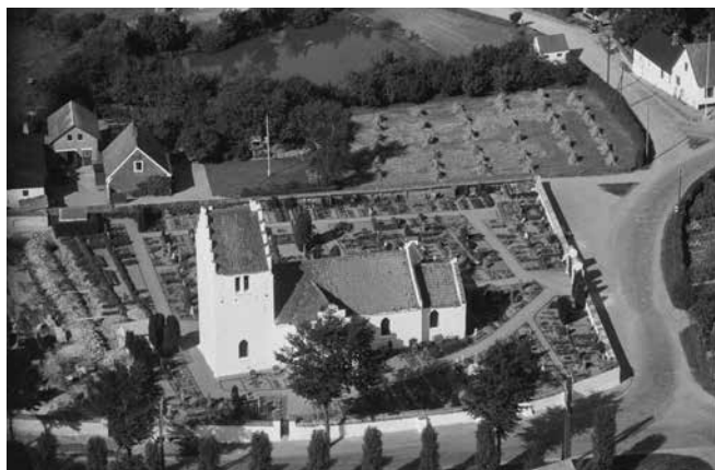
Sørbymagle Kirke.

Kirkerup kirke blev opført i middelalderen med en kirkegårdsmur med forsvarsværker rundt om kirken. Der opstod nogle små landsbyer omkring kirken, som efterhånden voksede sammen til landsbyen med navnet Kirkerup. Omkring 1700 begyndte man at udvinde vand fra en kilde ved kirken. Indtægten fra kilden blev investeret i opførelsen af Kirkerup Hospital, hvor syge, fattige, gamle og psykisk syge kunne få ophold.