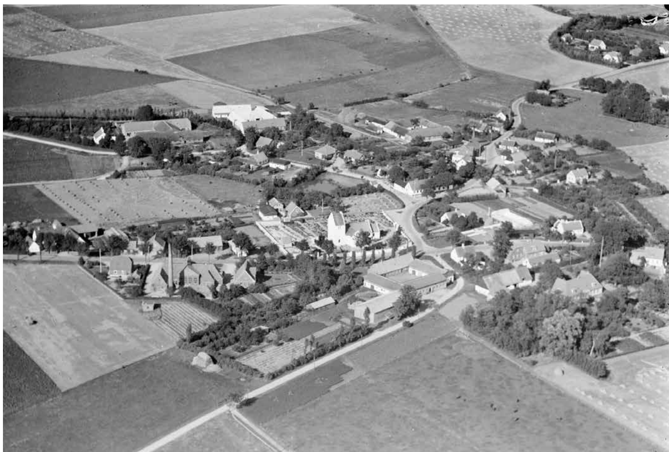
Sørbymagle i perioden 1946-1969.

Efter kommunesammenlægningen 1. april 1966 blev der lavet en udstykning nordøst for Sørbymagle , hvor der blev opført et nyt villakvarter. Den gamle landsbys struktur blev dog bevaret og eksisterer den dag i dag. Foruden kirken og forsamlingshuset, som stadig er i brug, vidner mange bygninger om et liv, der ikke længere eksisterer. Der har været mejeri, bager, købmandsforretning, høkerhandel, slagterbutik, skomagere, røgeri, telefoncentral, posthus, landsbysmed, cykelsmed og to banker. Missionshuset ligger overfor den nedlagte skole – bygninger som i dag er indrettet til boliger.