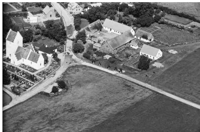
Kirkerup Kirke og Urtemosegård 1936-38.

Senere kom der skole, brugsforening, forsamlingshus, købmand, savværk, idrætsforening, sportsplads og sparekasse. Alle disse funktioner er nedlagt i dag. Hospitalet er i dag omdannet til ældreboliger.