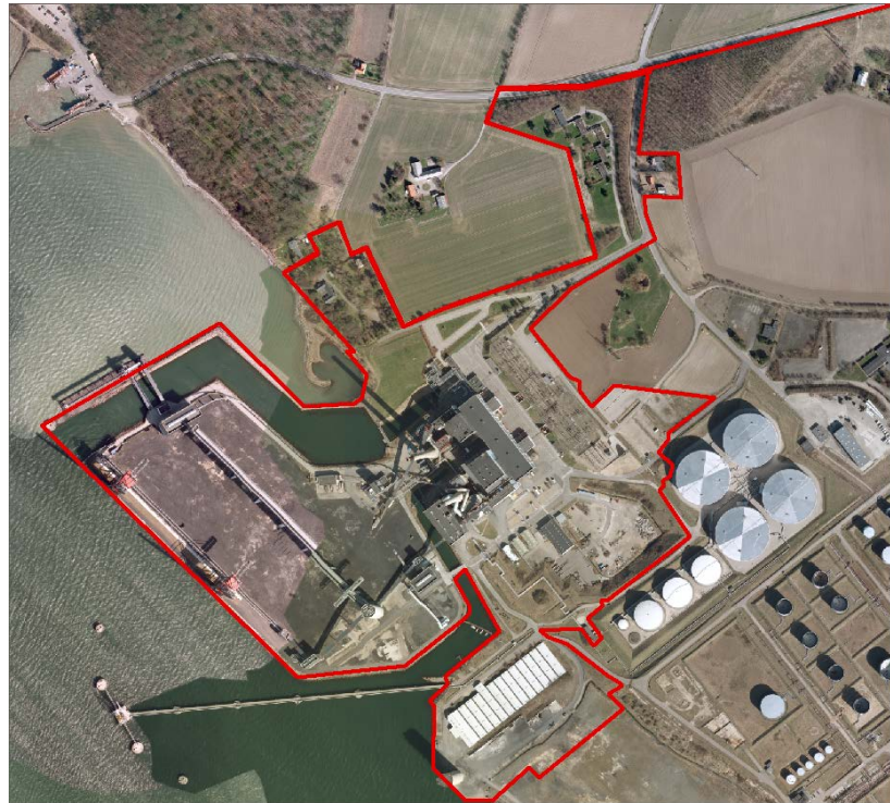
Fremtidigt dobbeltdækket forsyningsområde

Behov for vand af drikkevandskvalitet på ovenstående matrikler skal leveres af SK Forsyning A/S, og behov for vand til industriformål af ikke-drikkevandskvalitet skal leveres af SVIS.