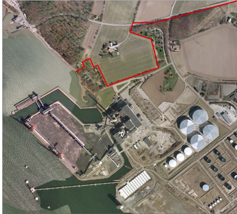
Eksisterende forsyningsgrænse i henhold til Vandforsyningsplan 2010-2020 for Slagelse Kommune

Den gældende "Vandforsyningsplan 2010-2020" for Slagelse Kommune er vedtaget af byrådet den 26. april 2011. Nedenfor er placeringen af den nuværende forsyningsgrænse mellem SVIS og SK Vand A/S vist.