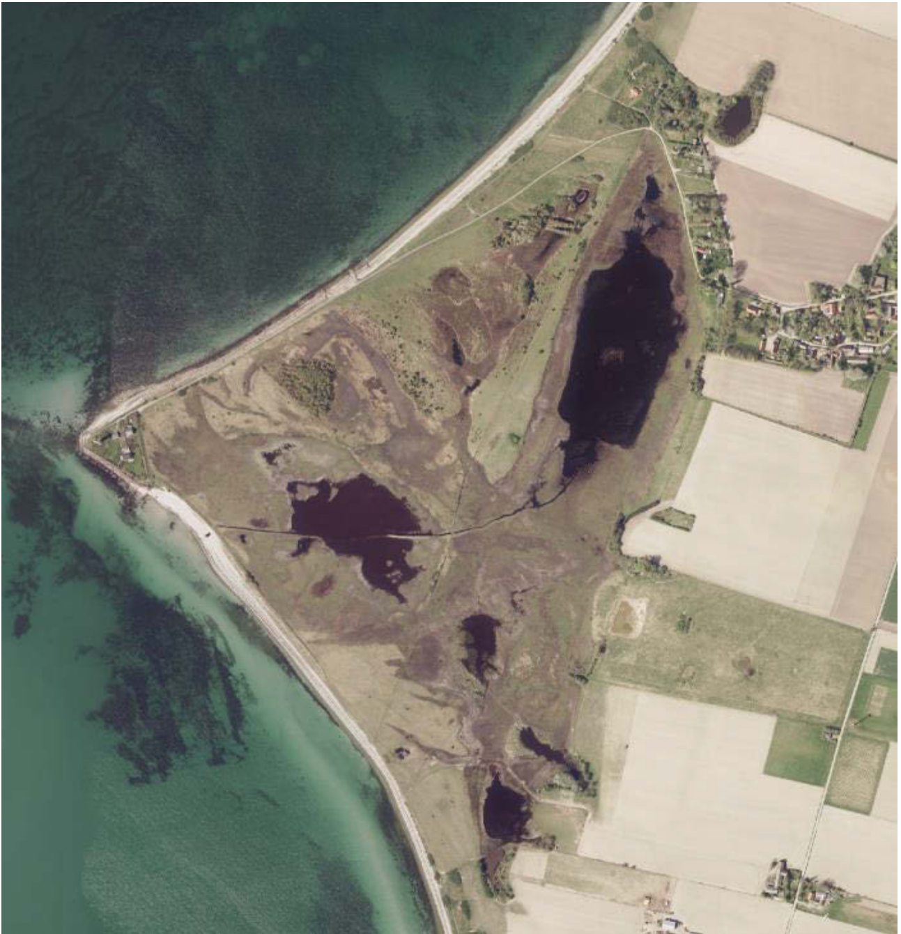
Slagelse Kommune/Mosen-Omø: Indsamlingslokalitet for grønbroget tudse- ægstreng, 2018.