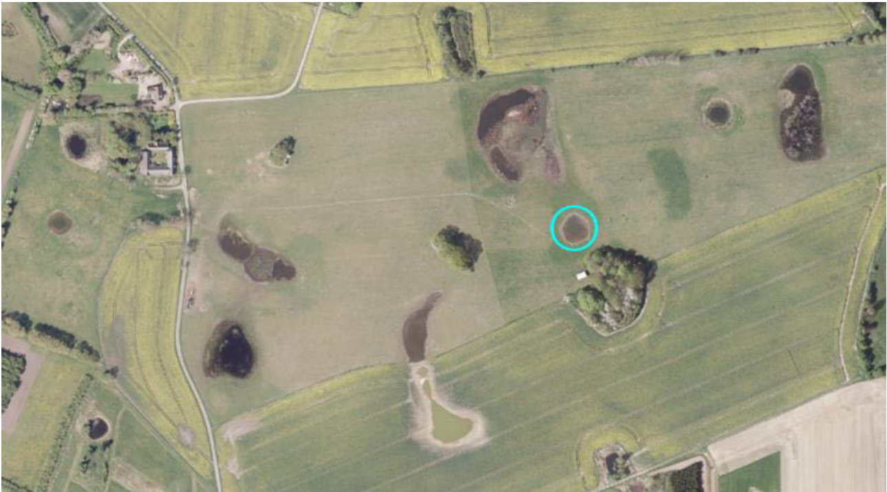
Slagelse Kommune/Stignæs: Udsætningsø for grønbroget tudse, 2018.