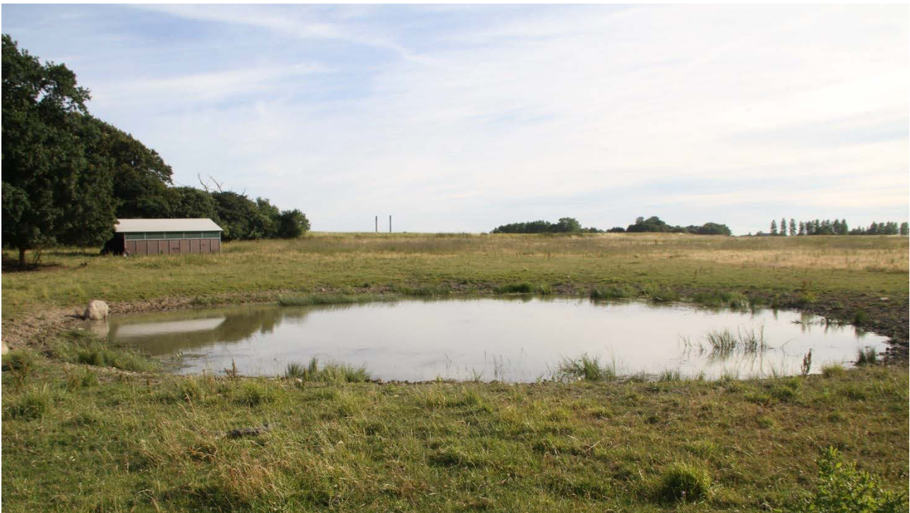
Slagelse Kommune/Stignæs: Udsætningsø for grønbroget tudse, 2018.